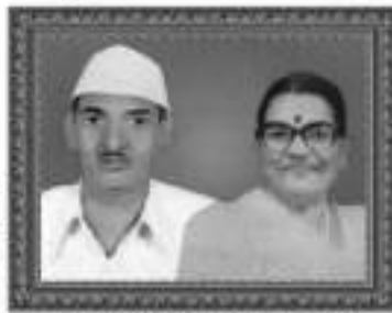
માતુશ્રી પરમાનેન ભારમલ જગશી છેડા